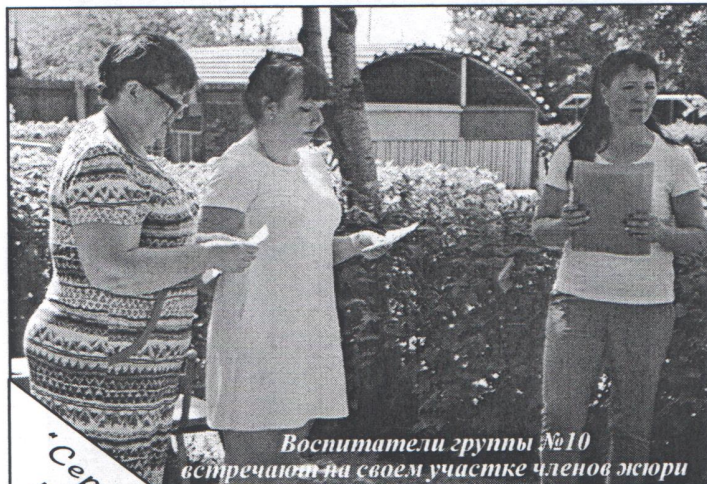
Воспитатели группы №10 встречают на своем участке членов жюри