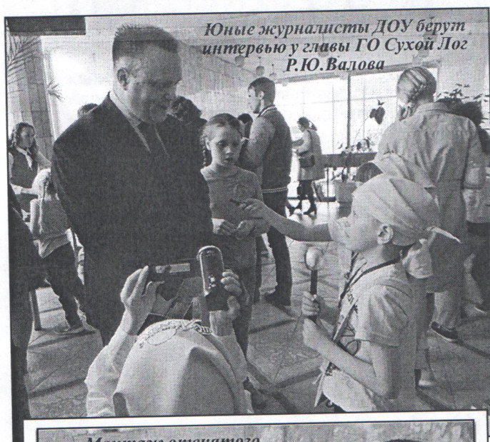
Юные журналисты ДОУ берут интервью у главы ГО Сухой Лог Р.Ю.Валова

К 1 ИЮНЯ ДОШКОЛЬНЫЕ ОБРАЗОВАТЕЛЬНЫЕ УЧРЕЖДЕНИЯ ГОРОДСКОГО ОКРУГА СУХОЙ ЛОГ ПОДГОТОВИЛИ ПОДАРОК ДЛЯ ДЕТЕЙ ВСЕГО РАЙОНА - ФЕСТИВАЛЬ-ВЫСТАВКУ ПОД НАЗВАНИЕМ ТЕХНОДЕНЬ.