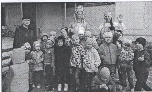
Праздник русской березки