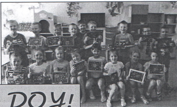
Воспитанники детского лагеря

4 ИЮНЯ на базе ДОУ открылся летний лагерь для выпускников нашего детского сада. 22 воспитанника посещают лагерь. С детьми работают специалисты ДОУ. Каждый день имеет свою тематику и свои традиции. Дети с радостью бегут в детский сад и ждут новых удивительных встреч.