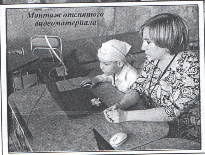
Монтаж отснятого видеоматериала

Образовательные учреждения представили свои возможности, опыт и современное оборудование. Ребята с удовольствием участвовали в мастер-классах: рисовали на воде, лепили необычным пластилином, рассматривали под микроскопом предметы, проводили опыты, играли в вязаные шашки, собирали машинки из конструктора, занимались программированием, знакомились с QR кодами, создавали мультфильмы, а дошколята нашего детского сада из кружка «Юный журналист» брали интервью у гостей и организаторов выставки и тут же монтировали фильм о происходящих событиях.