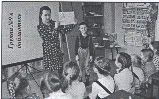
Группа №9 в библиотеке