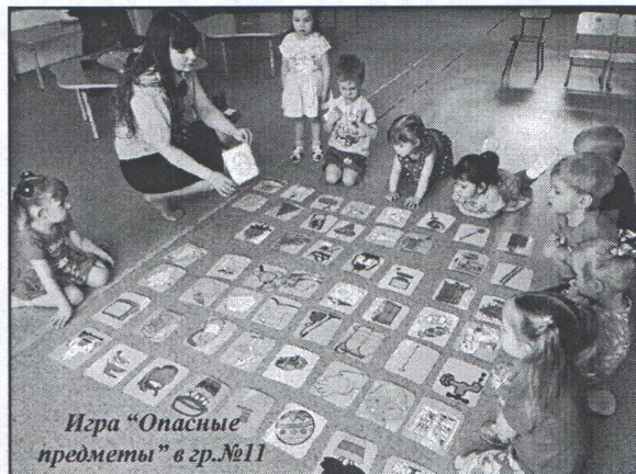
Игра «Опасные предметы» в гр.№11