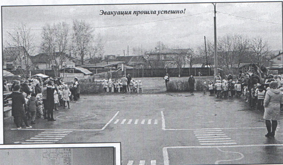
Эвакуация прошла успешно!

Впервые решили провести тренировку в вечернее время с участием родителей, чтобы отработать данную ситуацию. К сожалению, некоторые родители покидали здание