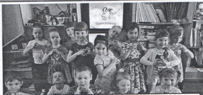
Единый день профилактики в группе №5 (беседа о правах ребенка)