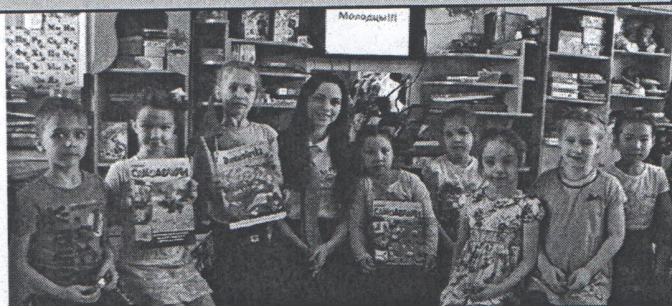
Вожатский отряд «ОМЕГА» (шк.№2) провели в группе №6 интерактивную игру «Один дома»