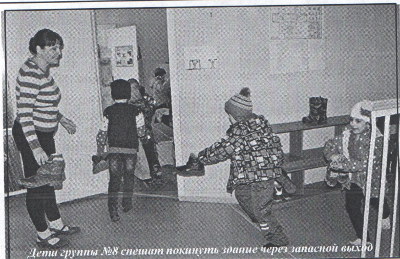
Дети группы №8 спешат покинуть здание через запасной выход

детского сада через центральный вход, хотя были уведомлены, что во время пожара из здания необходимо выходить через запасные выходы. Но большинство мам и пап вместе с детьми следовали указаниям.