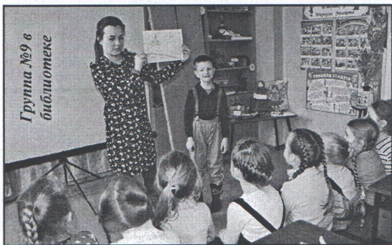
Группа №9 в библиотеке