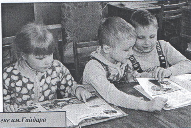
Воспитанники группы №9 в детской городской библиотеке им.Гайдара

А в нашем детском саду 268 воспитанников. Все дети у нас веселые, активные, позитивные; они поют, танцуют, занимаются спортом, посещают библиотеки, музеи - одним словом, познают окружающий мир!