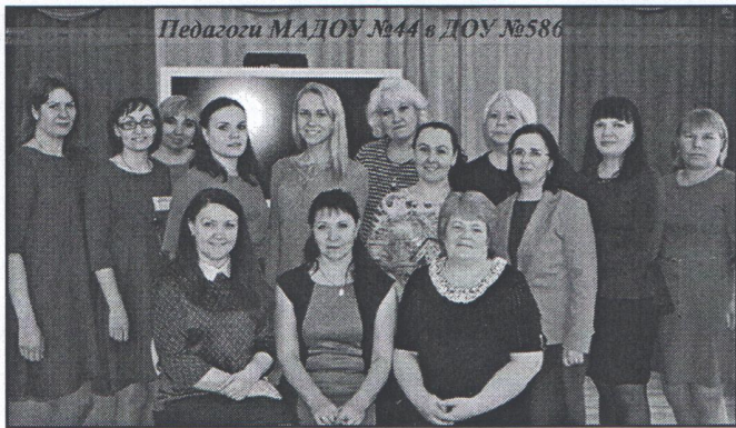
Педагоги МАДОУ №44 в ДОУ №586

■ 20 апреля коллектив педагогов нашего образовательного учреждения с дружеским визитом побывал на семинаре-практикуме по теме «Инновационная образовательная среда детского сада» у коллег в г. Екатеринбурге ДОУ № 586 «Остров детства». Участники семинара отметили теплый прием хозяев и значимость представленного опыта. Надеемся, что впереди будут еще новые встречи и новые практики.