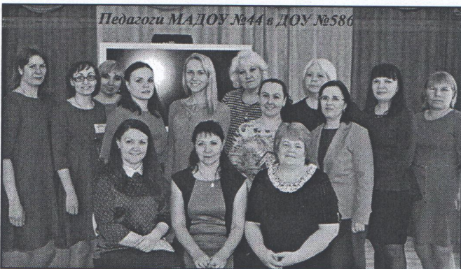
Педагоги МАДОУ №44 в ДОУ №586

■ 20 апреля коллектив педагогов нашего образовательного учреждения с дружеским визитом побывал на семинаре-практикуме по теме «Инновационная образовательная среда детского сада» у коллег в г. Екатеринбурге ДОУ № 586 «Остров детства». Участники семинара отметили теплый прием хозяев и значимость представленного опыта. Надеясь, что впереди будут еще новые встречи и новые практики.