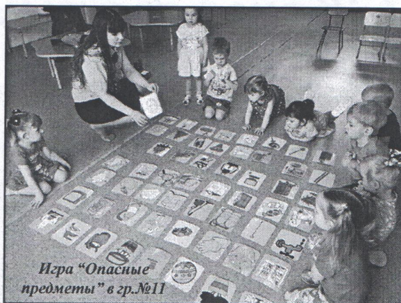
Игра «Опасные предметы» в гр.№11