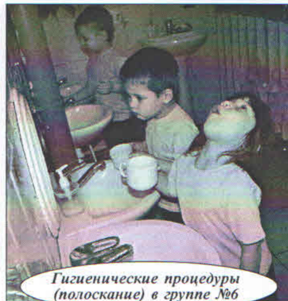
Гигиенические процедуры (полоскание) в группе №6

Правильное питание - очень важная штука. С пищей наш организм получает полезные вещества, которые нужны ему для нормальной работы и здоровья. Поэтому, в первую очередь, еда должна быть здоровой! Белки (рыба, яйца, сыр, рис, орехи) просто необходимо для роста. Из белков, как из кирпичиков, строится тело человека.