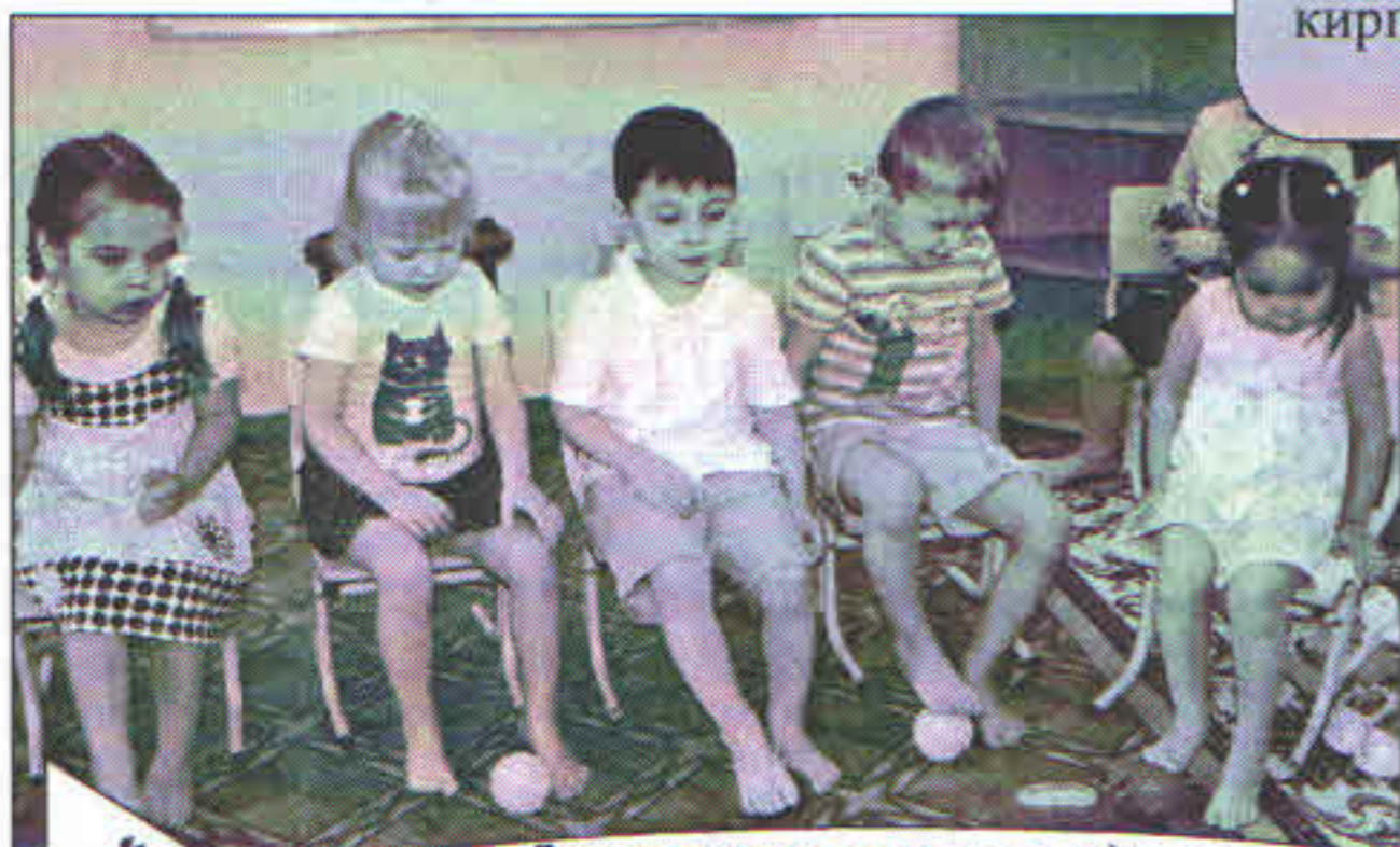
Закаливающие процедуры в группе №2