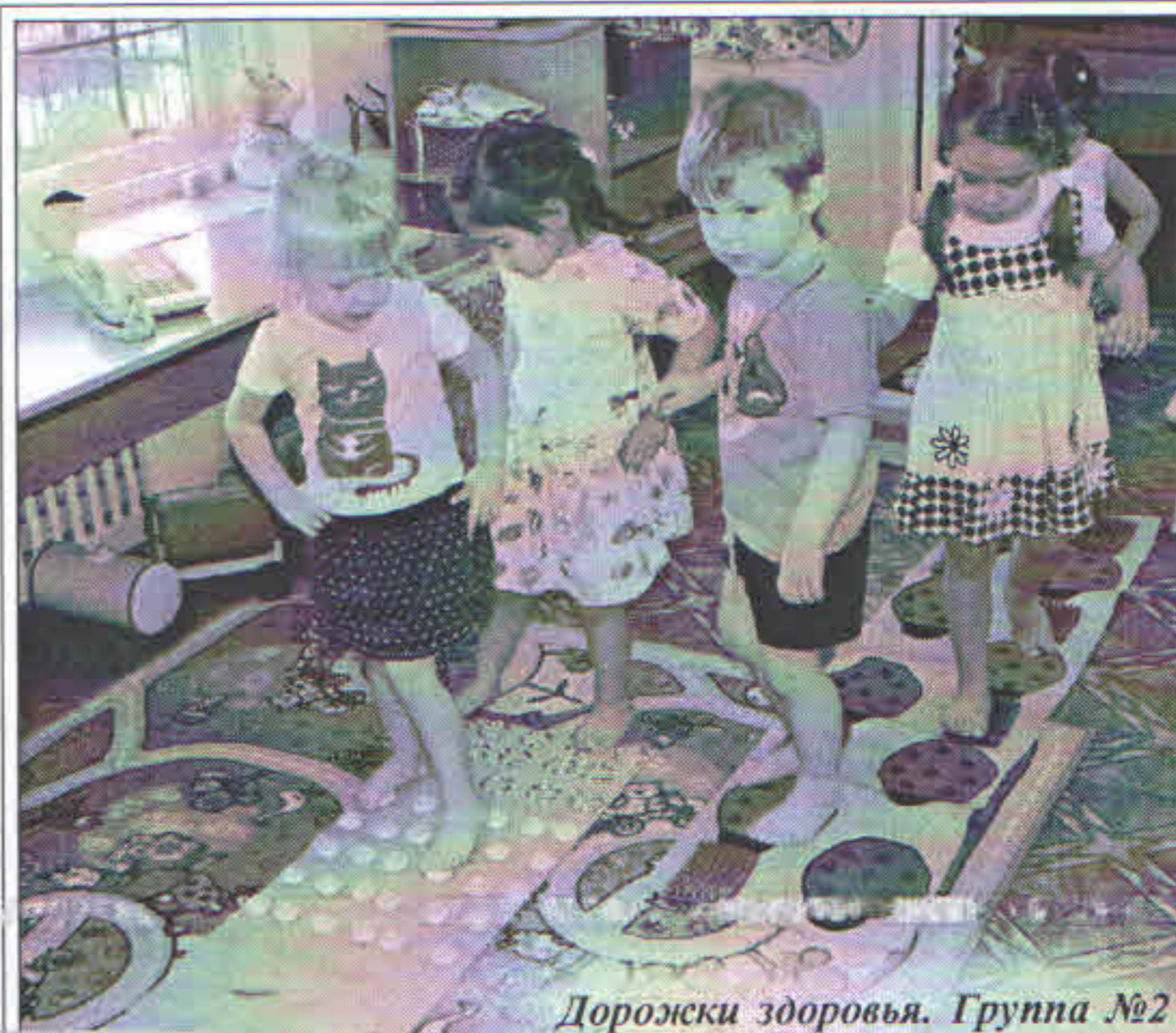
Дорожки здоровья. Группа №2

Задача взрослых – воспитать ребенка так, чтобы желание быть здоровым было таким же естественным, как желание есть и пить. Этот выпуск газеты посвящен формированию полезных привычек у детей в становлении ценностей здорового образа жизни (в питании, двигательном режиме, закаливании).