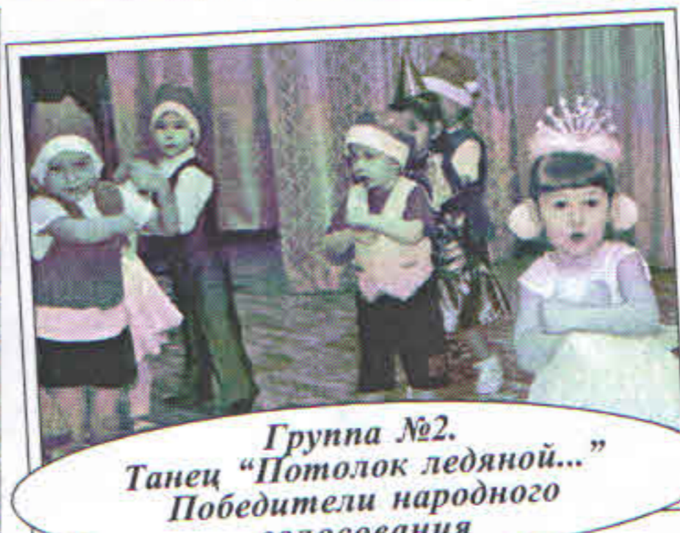
Группа №2. Танец “Потолок ледяной...” Победители народного голосования