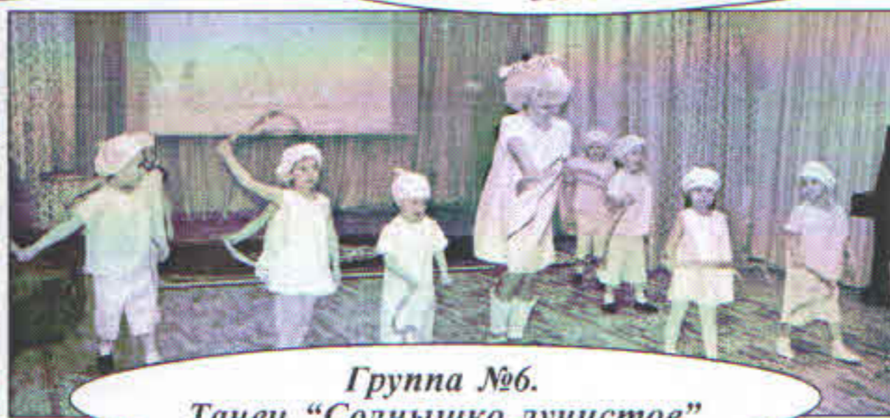
Группа №6. Танец “Солнышко лучистое”