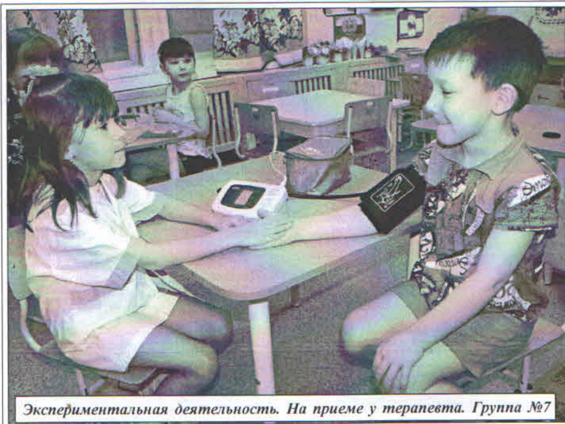
Экспериментальная деятельность. На приеме у терапевта. Группа №7

Врачи считают, чтобы сердце и сосуды были здоровыми до самых преклонных лет, необходимо с самого раннего детства учить ребенка соблюдать режим дня, бережно относиться к своему здоровью, вести активный образ жизни, питаться здоровой пищей. Не забывайте, что пример взрослых - это всегда урок для малышей! Ведите здоровый образ жизни и растите здоровых детей!