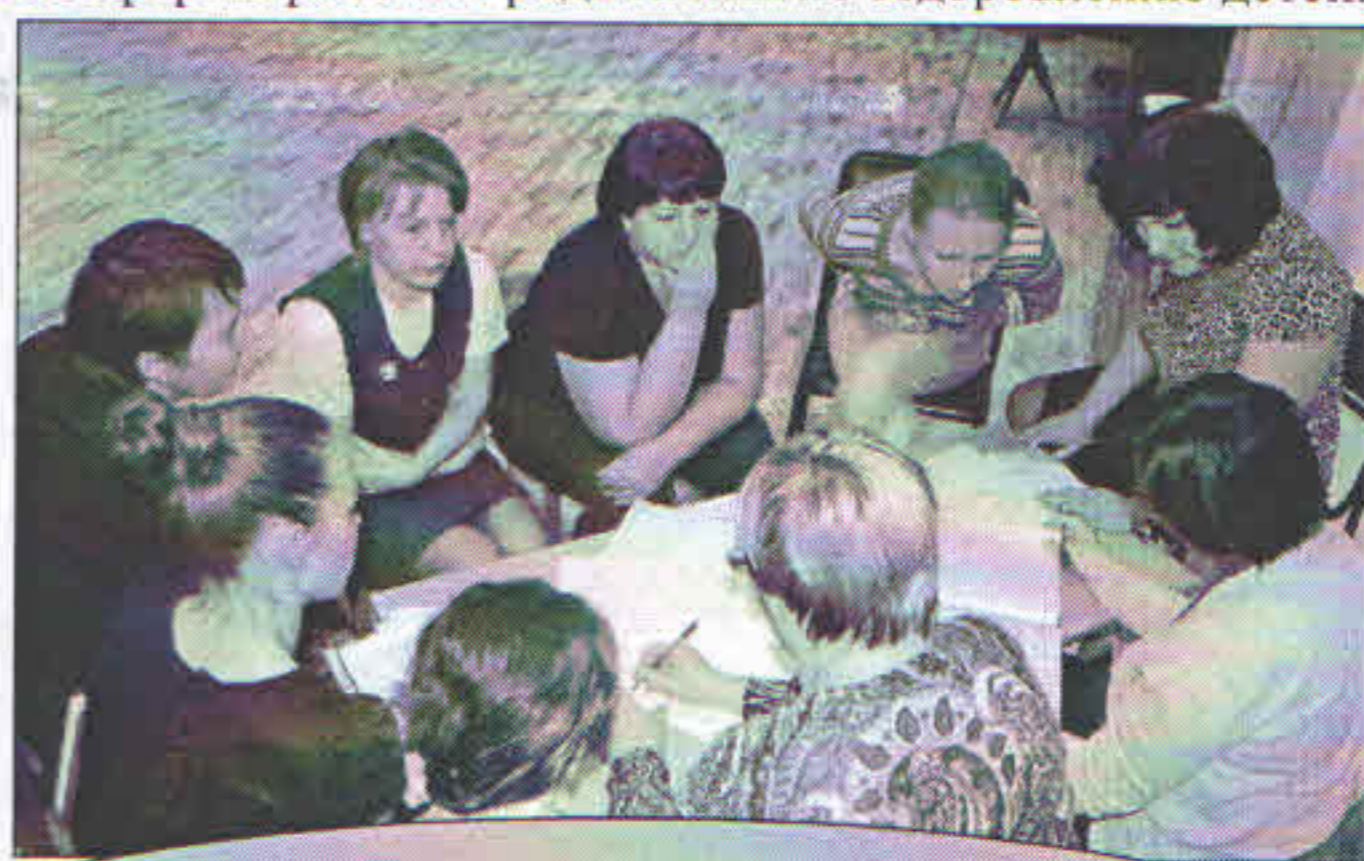
Педагогический Совет. Деловая игра «Педагогический поединок» (слева), принятие решения творческой группой №1 (справа)

◆ 25 ноября прошел праздничный концерт для любимых мамочек. Воспитанники 9 групп обыгрывали популярные песенки и поздравляли своих мамочек с праздником (фоторепортаж на стр.7).