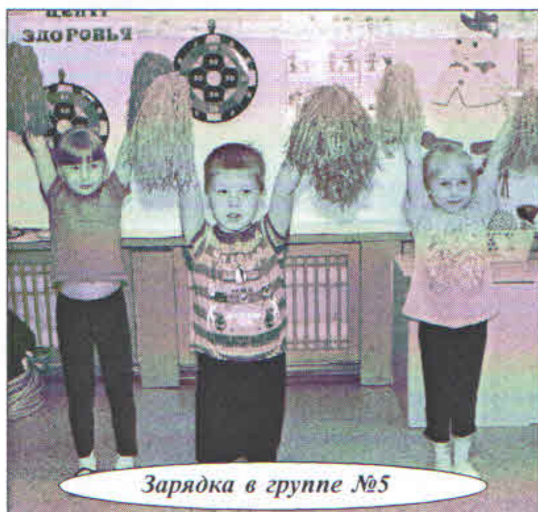
Зарядка в группе №5

(подъем, зарядка, прогулка, дневной сон...)