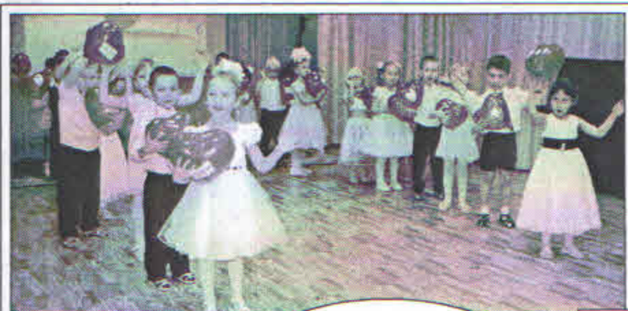
Группа №10. Танец “Мамино сердце”