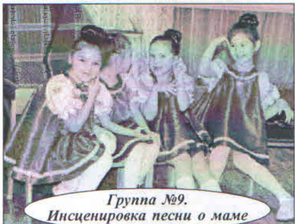
Группа №9. Инсценировка песни о маме