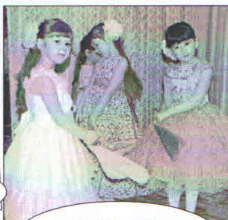
Группа №7. Танец для мам