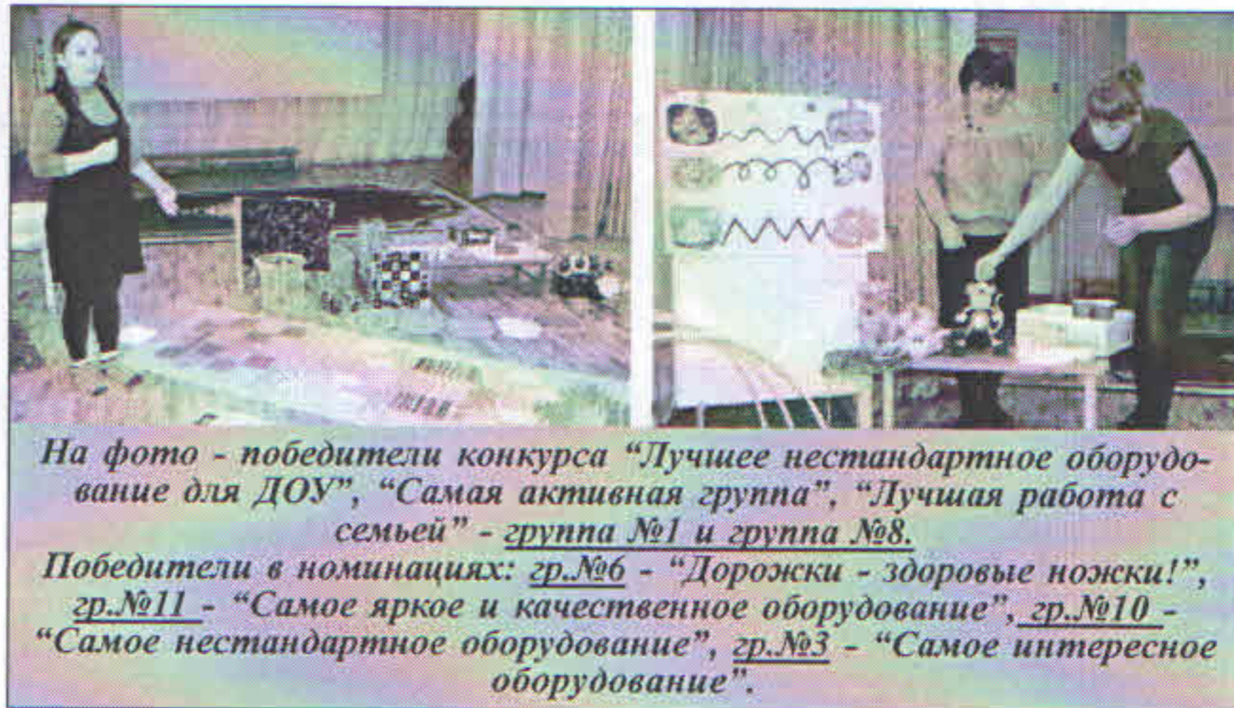
На фото - победители конкурса «Лучшее нестандартное оборудование для ДОУ», «Самая активная группа», «Лучшая работа с семьей» - группа №1 и группа №8.

◆ 23 ноября были подведены итоги конкурса «Лучшее нестандартное оборудование для детского сада». 6 групп – группы №1, №3, №6, №8, №10, №11 представили новинки физического оборудования. Порадовало то, что более 30 семей воспитанников приняли участие в конкурсе, тем самым они внесли свою лепту в развитие предметно-развивающей среды своей группы.