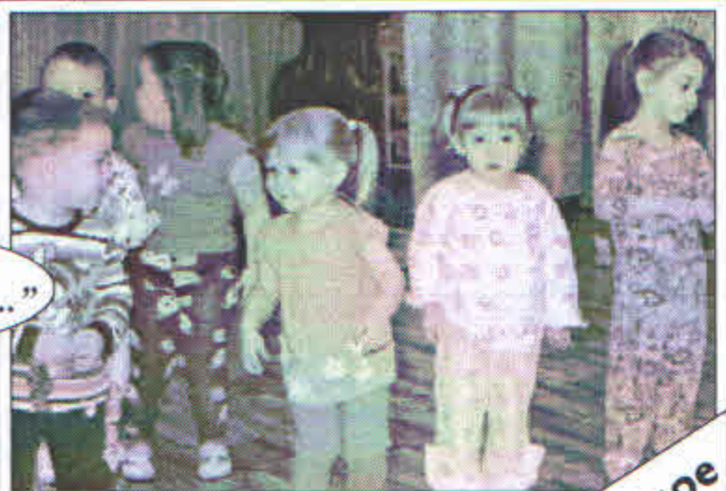
“Серебряное копыце” №44

ПИШИТЕ! ЗВОНИТЕ! Мы всегда открыты для общения!