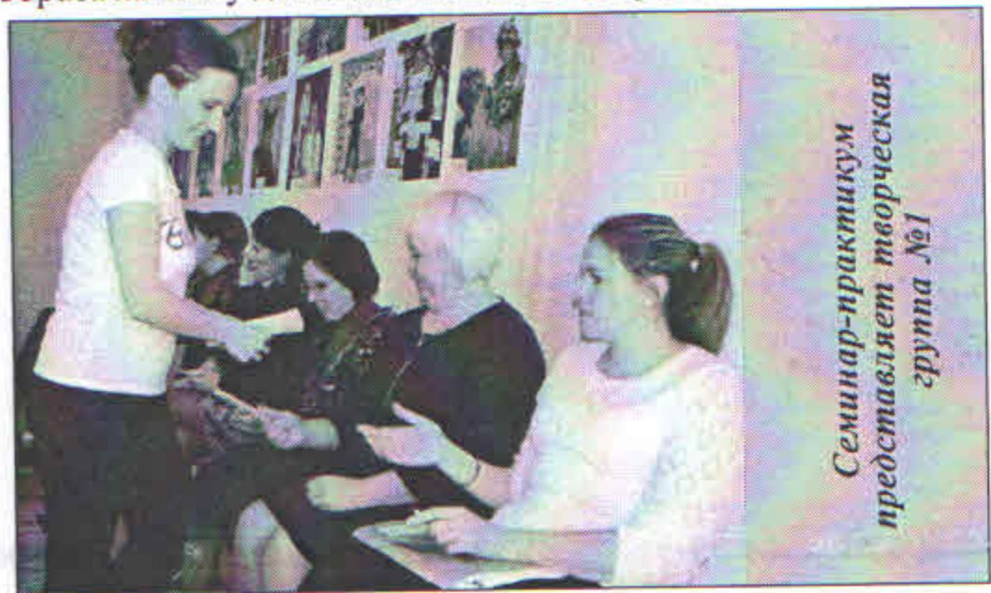
Семинар-практикум представляет творческая группа №1

♦ 11 ноября на семинаре – практикуме педагоги делились друг с другом мастерством по развитию двигательных умений и становлению ценностей здорового образа жизни у детей дошкольного возраста.