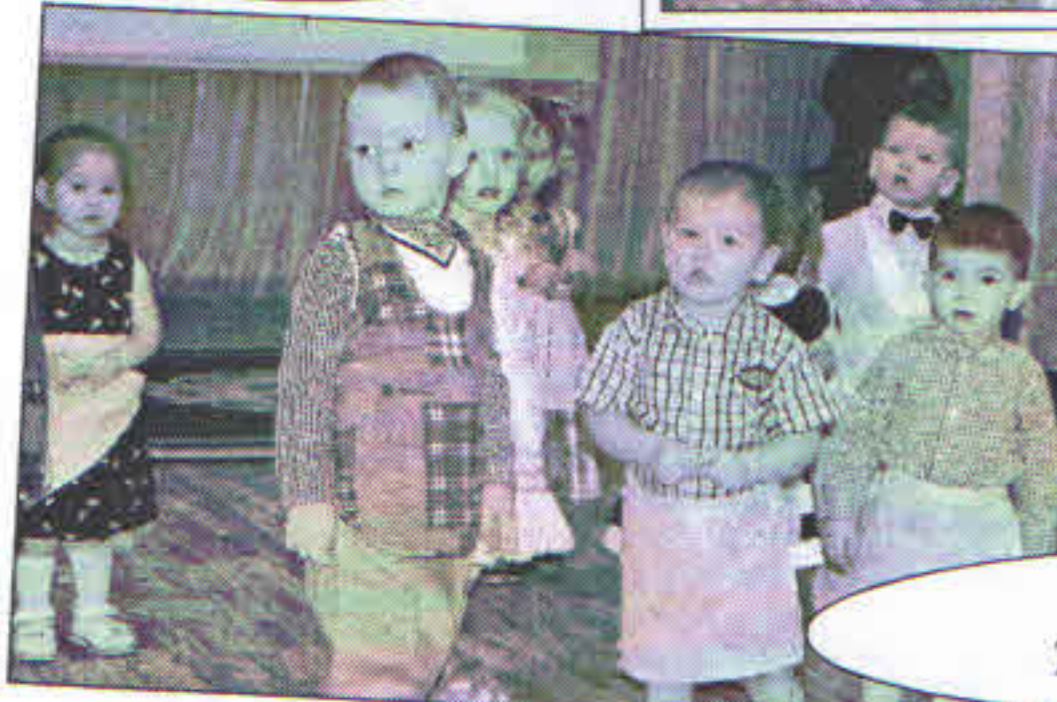
Группа №11. Танец для мам