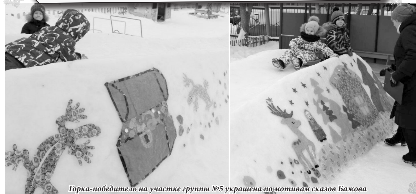
Горка-победитель на участке группы №5 украшена по мотивам сказов Бажова

31 января подведены итоги конкурса «Ах ты, горочка-гора!». В конкурсе приняли участие 10 групп. Оценивались: внешний вид, безопасность и функциональность горки.