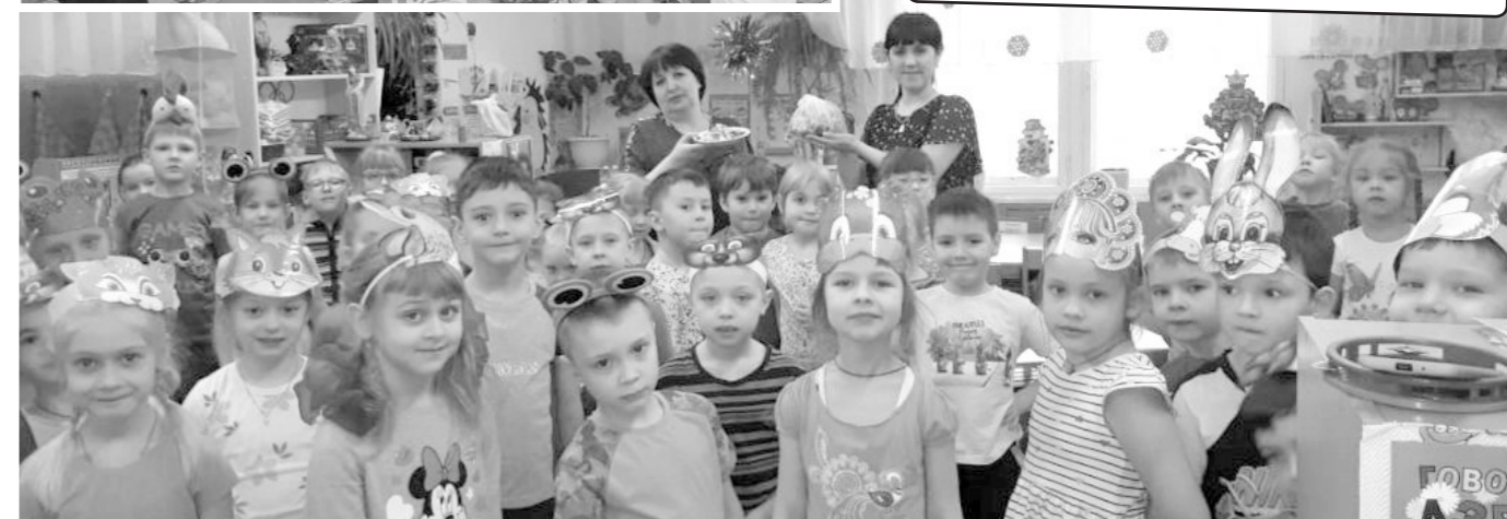
Группа №7 в гостях у группы №10

Праздник получился весёлым, вкусным и познавательным. Спасибо воспитателям, которые организовали эти мероприятия!