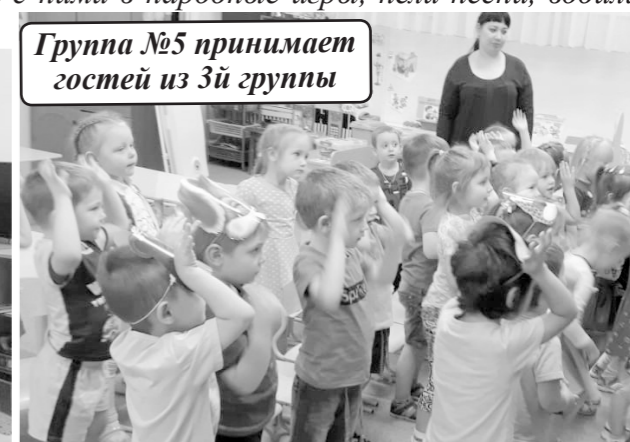
Группа №5 принимает гостей из 3й группы