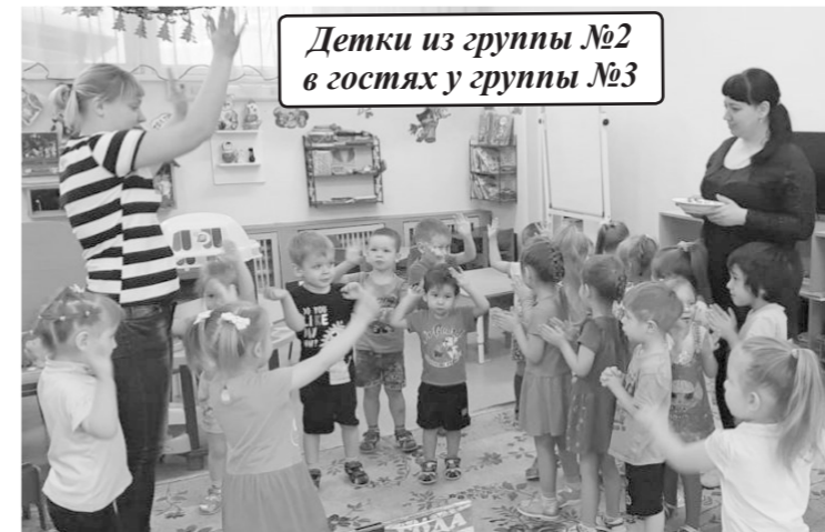
Детки из группы №2 в гостях у группы №3

«хозяев». Они встречали ряженных гостей: играли с ними в народные игры, пели песни, водили хороводы и угощали сладостями.