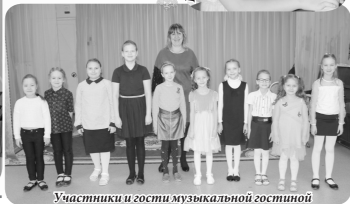
Участники и гости музыкальной гостиной