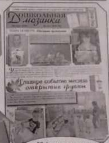
99-й номер газеты "Дошкольная мозаика", октябрь 2020 г.