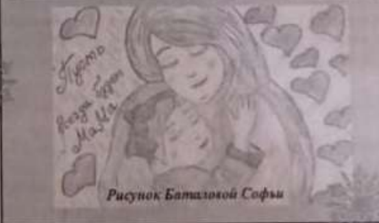
Рисунок Баталовой Софьи