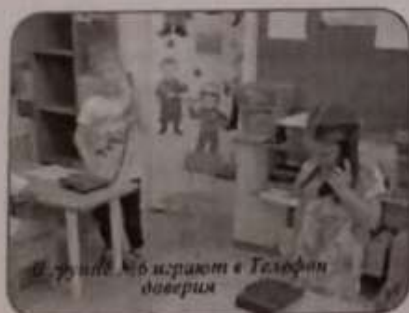
В группе №6 играют в Телефон доверия

Очень важно, когда у ребенка есть друг, которому он может рассказать о своих проблемах. Ребята подготовительных групп №8 и №6 по телефону Доверия рассказывали о своих чувствах, проблемах, событиях друзьям.