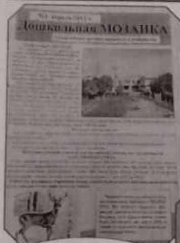
Первый номер газеты "Дошкольная мозаика", апрель 2012 г.

ТЕМА НОМЕРА: «Жила-была одна газета, или 100-й юбилейный номер»