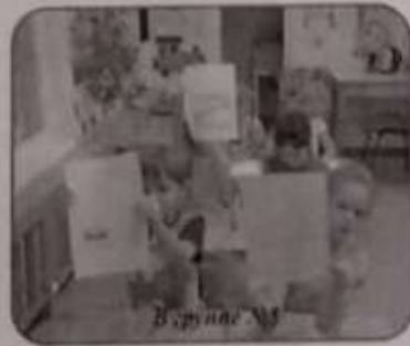
В группе №8

А в старшей группе №10 прошло занятие "Телефон доверия - мой друг". Дети познакомились с понятием "Телефон доверия" и узнали, кому можно позвонить в трудной жизненной ситуации.