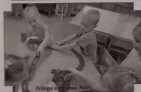
Резина и Гурьяны №10

Единый день безопасности прошел 12 ноября. В этот день педагоги провели с детьми беседы, игры, тематические досуги. Данные мероприятия направлены на профилактику чрезвычайных происшествий с несовершеннолетними.