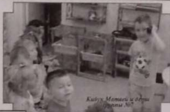
Кубок Мамы и папы Группы №7

9 ноября прошел День пожарной безопасности. Во всех группах в первую половину дня прошли занятия, беседы по безопасному поведению во время пожаров, дети смотрели обучающие фильмы. Во вторую половину дня прошли познавательные игры, игры-соревнования, развлечения, где дети играя, закрепляли полученные знания. Состоялось торжественное посвящение юных пожарных в отряд ДЮП «Огонек». Для родителей педагоги и дети подготовили памятки, в социальных сетях транслировали видеофильмы и ролики по ПБ.