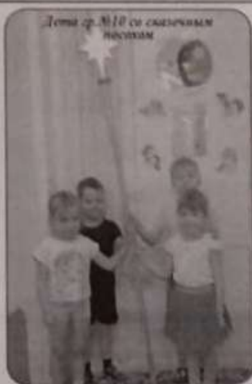
Дети гр.№10 со сказочным посохом